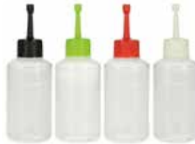
Spermaflaschen mit Deckel 100 ml 500 Stk. 87.30