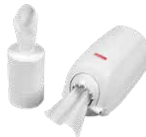
Papierspender CHF 57.40