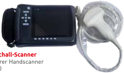
Ultraschall-Scanner Tragbarer Handscanner 2240.00