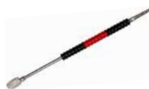
Lanze mit Pendeldüse z.B. zu MBH 1260 CHF 360.00