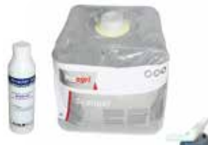
Scan Gel 250 ml 11.50 5 Liter 25.90