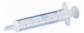
Einwegspritze 2 / 5 / 10 / 20 ml 100 Stk. ab 7.40