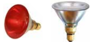
Infrarotsparlampe rot/weiss 100 W 12 Stk. 89.40 175 W 12 Stk. 106.80