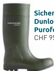
Sicherheitsstiefel Dunlop Purofort S5 CHF 95.50