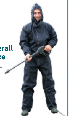
Waschoverall mit Kapuze M bis XXXL CHF 99.50