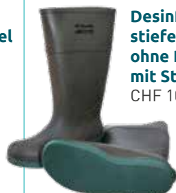
Desinfektions- stiefel ohne Profil mit Stahlkappe CHF 105.90