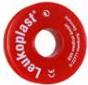
Leukoplast 1.25 cm x 9.2 m 1 Stk. 4.30 24 Stk. 4.10 / Stk.