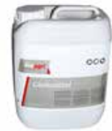
Gleitmittel 1 Liter 5.40 5 Liter 22.80