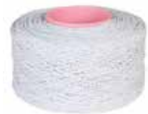
Gummiband für Besamungstuben 49.90