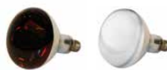
Infrarotlampe rot/weiss 150 W 10 Stk. 58.00 250 W 10 Stk. 62.00