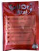
Spermaverdünner CellOr 1 Stk. 6.50 100 Stk. 5.95 / Stk.