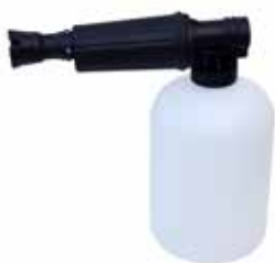
Schaumpistole CHF 79.50