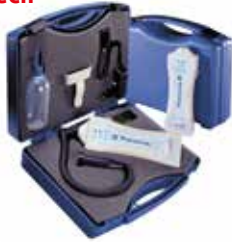
Trächtigkeitstester Rheintech 442.00