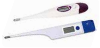
Fieberthermometer Normal 12.50 VET 12 extra lang 14.50