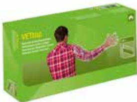
Veterinär-Einmalhandschuhe 100 Stk. 20.70