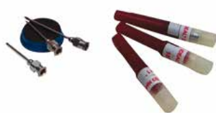
D3 Nadeln 1.65x25/1.65x40/1.2x16 mm 100 Stk. 71.40