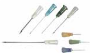
Einwegnadeln 0.8x16/0.9x12/1.2x40 mm 100 Stk. ab 8.15