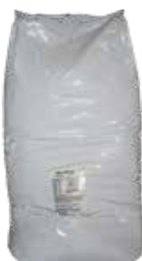
Wühlerde Baby Fer Pig 1 Sack 24.75 48 Sack 22.30