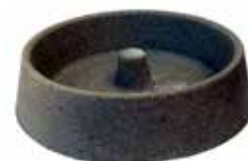
Ferkelnapf Poliesterbeton 21.20