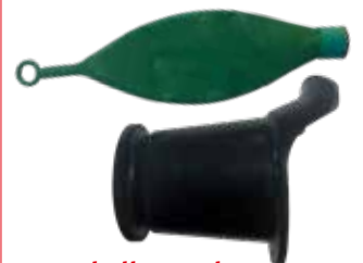
Atemballon und Manschette zu Pigsleeper