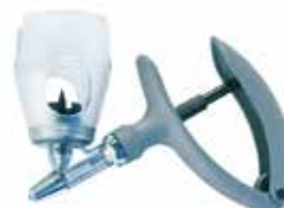
Injektionspritze Eco-Matic 0.3 / 1.0 / 2.0 / 5.0 ml ab 33.20